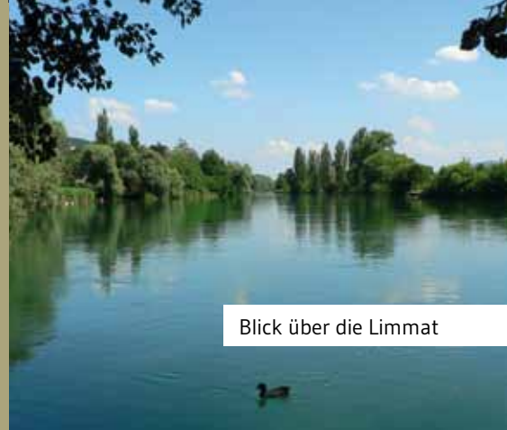
Blick über die Limmat